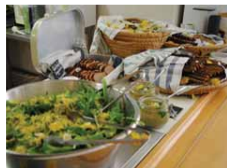
Mat är en viktig del på skolan. Alla arbetsdagar avslutas med en gemensam lunch av det som skördats.

Permakultur Sverige www.permakultur.se , Skånes Kärngårdsförening http://www.skaneskarngardar.se , Skogsträdgårdens vänner http://skogstradgardensvanner.se Omställningsnätverket omstallning.net