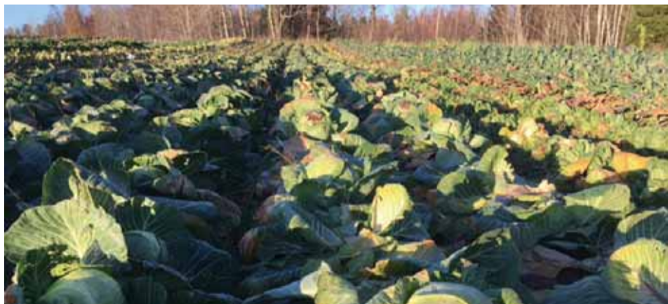
Det stora mäktiga vitkålslandet. Skördas efterhand så länge inte kylan blir för hård.

Gården Upsala 2:1 ligger på Billings västsluttning, omkring 5 km från Varnhem. Arealen är omkring 16 ha åker- och betesmark och lika mycket lövskog. Jorden är mullrik, lerig, sandig morän med högt pH-värde. Egen brunn, karpdammar, 2 äldre ladugårdar med utvecklingsmöjligheter, den ena är inredd för hästar. Här finns 3 bostadshus varav ett är uthyrat och en sommarstuga.