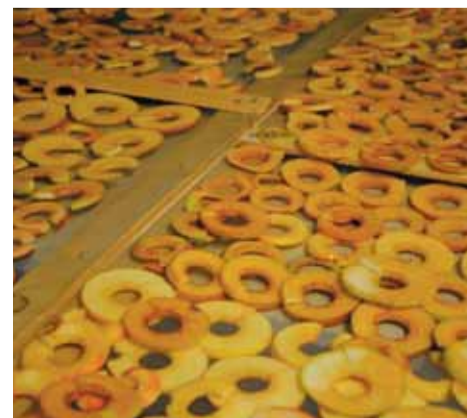
Under en gemensam arbetsdag togs äppelskörden om hand.