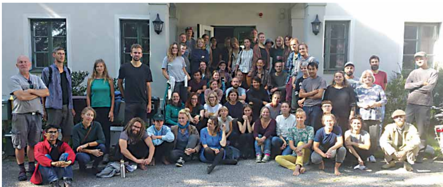
En gång varje termin samlas alla skolans deltagare på Holma gård för en gemensam arbetsdag och lunch.