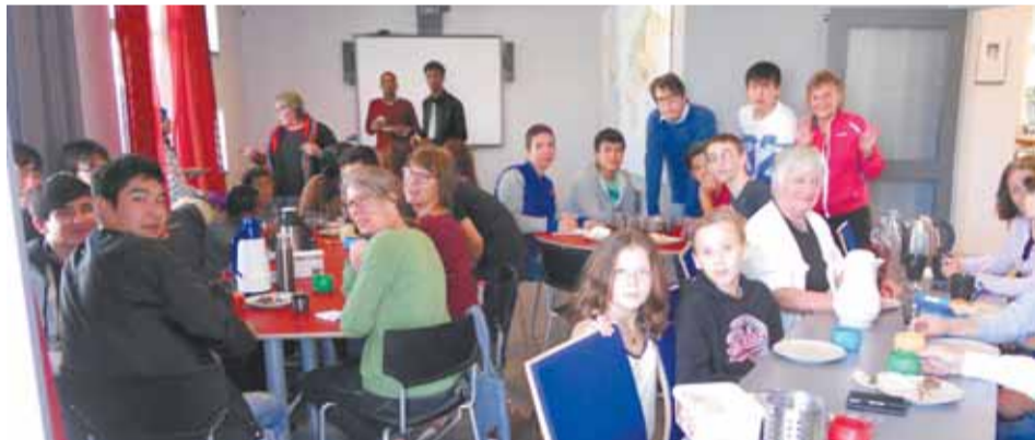
Gränslöst kul med mångkulturellt fika.

Föreningen har gått på lågvarv under de senaste åren men inte lagts ner. Under hösten 2015 uppstår den svåra flyktingsituationen även i Grästorp. Och då beslutar några eldsjälarna i Agenda 21-föreningen att inbjuda till en träff kallad